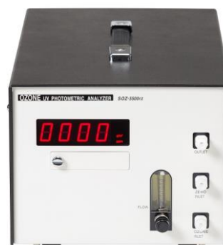
OZG-5500 型ポータブルタイプ

OZG-5500型は、ラックマウントタイプ (OZG-5300型) と同じ仕様のポータブルタイプ (OZG-5500型)、のオゾンガス濃度計です。オゾン発生源や排ガスなど、現場での濃度チェックに最適です。