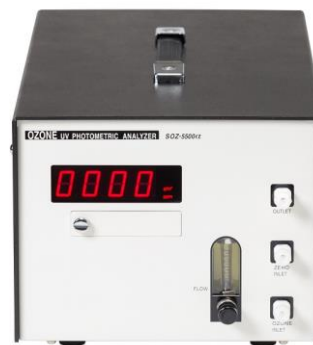
OZG-5500型ポータブルタイプ

OZG-5500型は、ラックマウントタイプ (OZG-5300型) と同じ仕様のポータブルタイプ (OZG-5500型)、のオゾンガス濃度計です。オゾン発生源や排ガスなど、現場での濃度チェックに最適です。